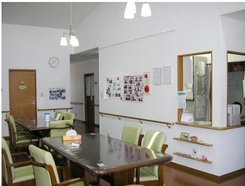
2Fリビング・事務室